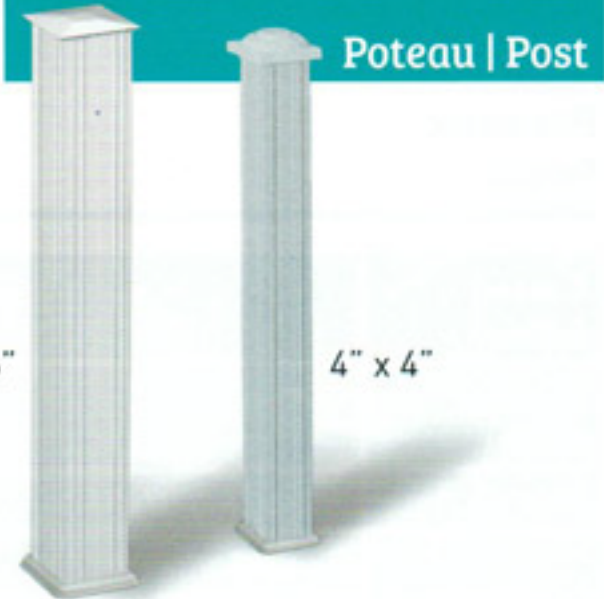
Poteau | Post